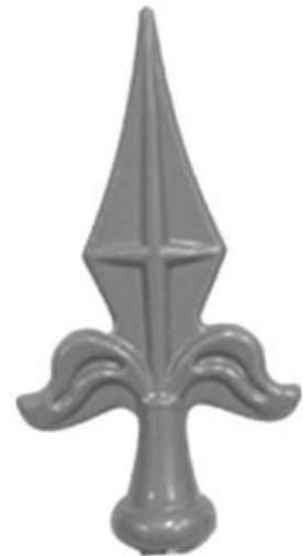
F 02 référence : 340 Hauteur - 145 mm