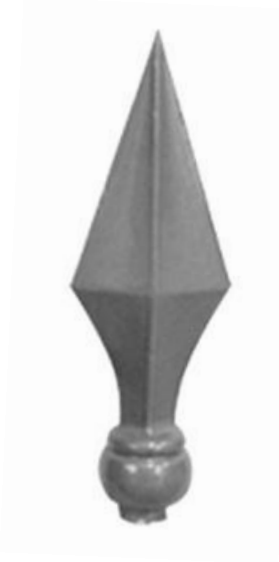
F 01 référence : 340 100 Hauteur - 145 mm

Emmanchement standard Ø15,5 mm hauteur 30mm Autre diamètre possible sur demande