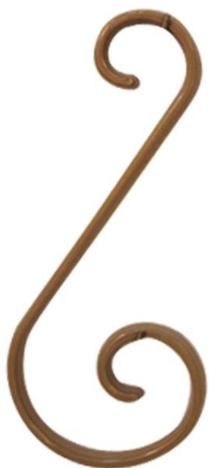
VS 01 référence 342 000 Hauteur – 240 mm Largeur – 105 mm