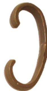
VS 02 référence 342 100 Hauteur – 105 mm Largeur – 50 mm