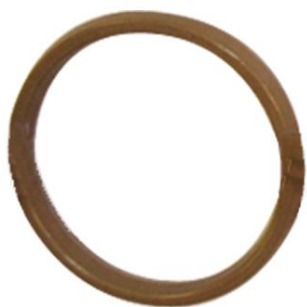
VS 03 2 modèles Ø 90 mm Ø 105 mm