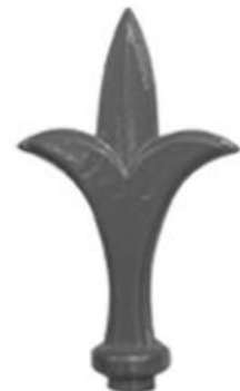
F 07 référence : 340 16C Hauteur - 115 mm