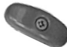
½ Noix de fixation référence 600 003 Pour des barreaux maxi de 20 mm