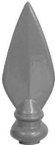
F 06 référence : 340 150 Hauteur - 145 mm